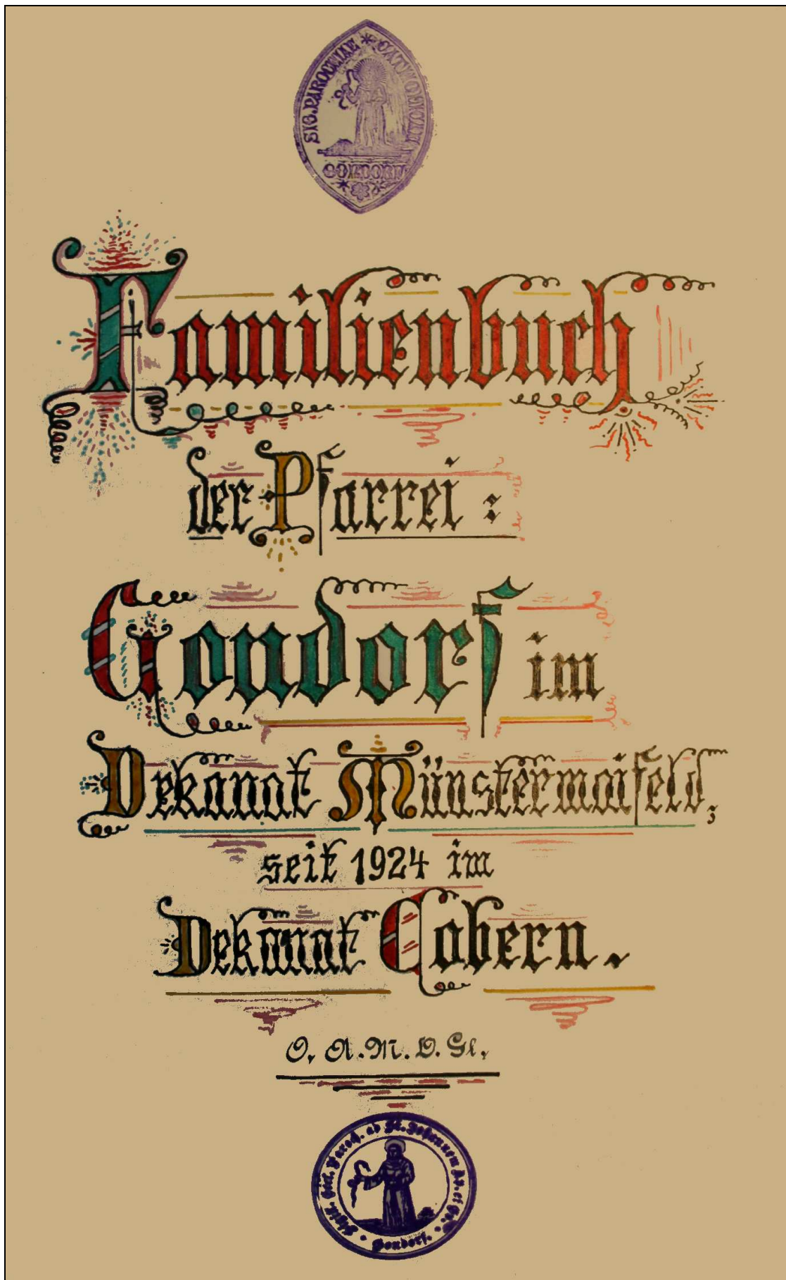
Wunderschöne Seite des Familienbuches der Pfarrei St. Johannes Evangelist zu Gondorf